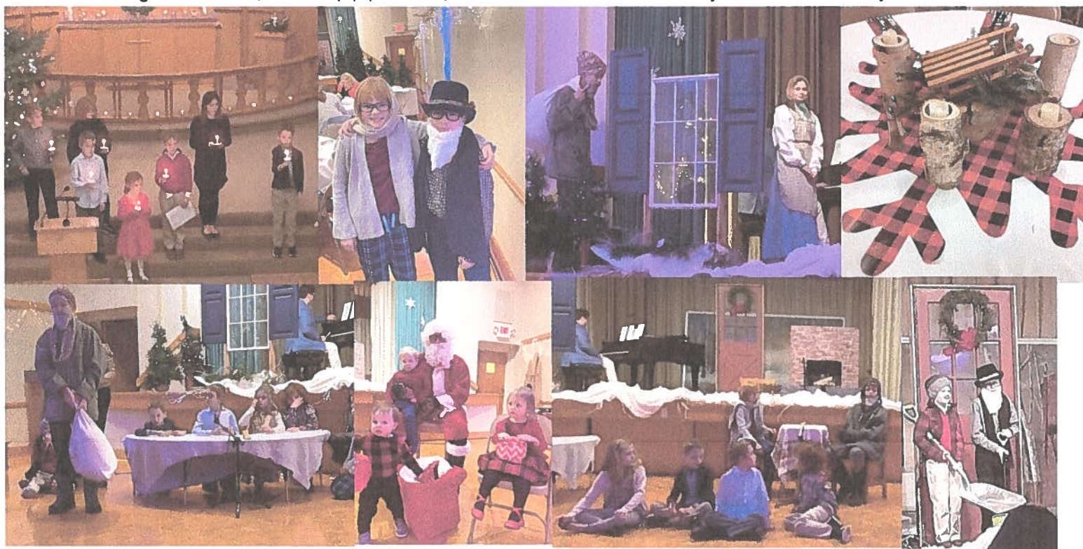
Skati no Svecīšu Dievkalpojuma un Ziemassvētku Egļīte